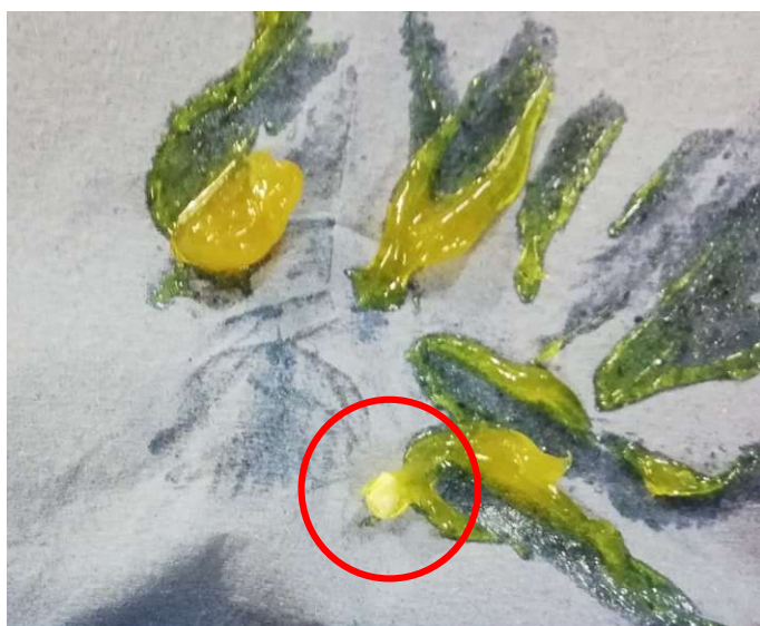
Kartuschen Teil im Fett