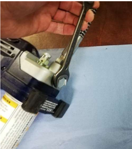
Verschlusschraube des Rückschlagventils öffnen