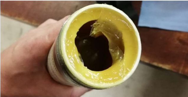
Bruchteile der Kartusche gelangen ins Fett

Ursache: Oftmals gelangen beim Kartuschen Wechsel Rückstände von den Kartuschen in das Fett und gelangen in den Pumpenraum dadurch kann danach kein Druck mehr aufgebaut werden.